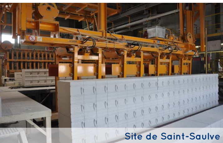
Site de Saint-Saulve

L'entrée de Cellumat au sein de la société Xella fait l'objet d'une intégration progressive et structurée selon 3 grands axes : l'intégration industrielle, l'intégration commerciale et l'intégration des produits Cellumat au catalogue des solutions proposées par Xella France.