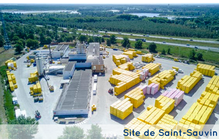
Site de Saint-Savin